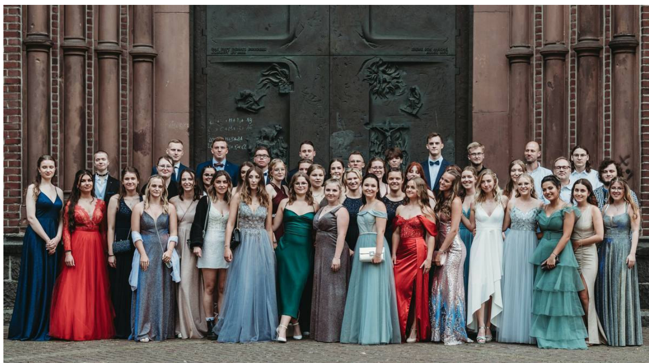
Die Abiturienten der Gesamtschule Nettetal im Sommer 2022.

27. Juni 2022 um 16:49 Uhr | Lesedauer: 2 Minuten